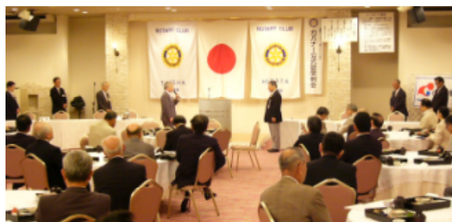
会長・幹事懇談会