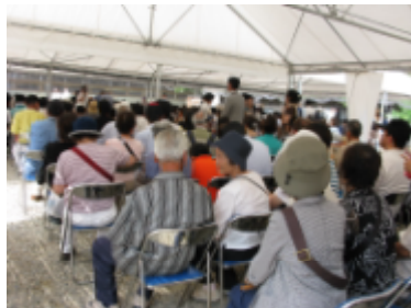
テントの中で待機