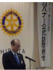
ガバナー公式訪問例会

いただき、その中でいくつかご指導・ご助言をいただきました。この後は、ガバナーの卓話を拝聴させ