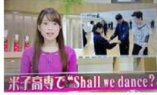
米子高専で"Shall we dance?"

学生時代に社交ダンスと出会い 8年前にダンスを再開 アマチュアスタンダードA級選手として 競技会に出場！