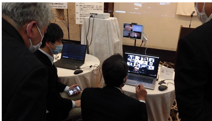
WEB例会終了後の意見交換